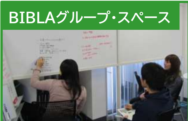
BIBLAグループ・スペース