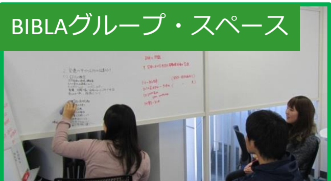
BIBLAグループ・スペース